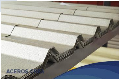
Lámina de acero acanalada con perfil traapezoidal esta diseñada para ser utilizada como cubierta de fijación expuesta. Disponible en Zintro , ZintroAlum y Pintro . Ideal para muros, cubiertas y faldones de naves industriales, bodegas y construcciones en general.

Nuestra lámina de acero R-101 tiene excelente relación entre economía, capacidad estructural y capacidad de desagüe.